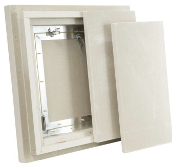
ouverture vers le bas