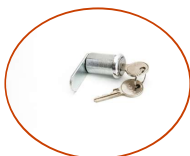
Serrure à cylindre